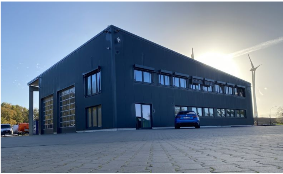
Verwaltung und Servicecenter (Bild: Kanalreiniger.eu).

Viele Kunden lassen ihr gebrauchtes Kanalreinigungsfahrzeug kostenfrei bewerten und sichern sich im gleichen Zug ein Neufahrzeug aus dem Angebot. Der Wert der Inzahlungnahme kann zum Beispiel in Verbindung mit den Mietmodellen angerechnet werden, und am Ende der vereinbarten Mietzeit und einer Schlusszahlung geht das Fahrzeug in Kundenbesitz über. Bis dahin haben alle Kunden Zeit, das Fahrzeug auf Herz und Nieren zu testen und sich hiervon überzeugen zu lassen.