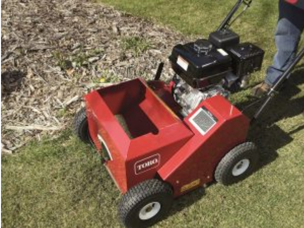
Beim Vertikutieren wird die