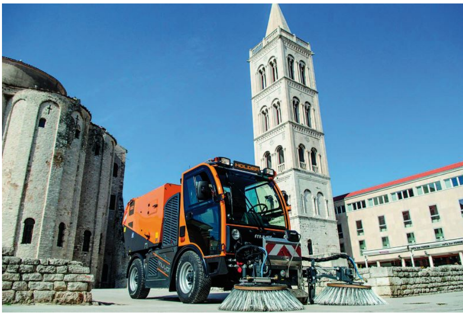
Das Multifunktionsfahrzeug Holder Muvo mit leistungsstarker und kompakter Kehrsaugmaschine SX2.